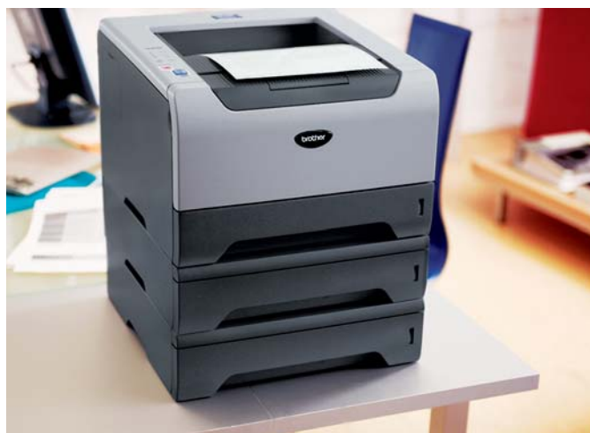
Brother HL-5240 mit zwei optionalen Papierkassetten LT-5300

Drucken Sie oft mehrseitige Dokumente mit der ersten Seite auf Geschäftspapier? Oder verwenden Sie verschiedene Papiergrößen? Der Brother HL-5240 ist standardmäßig mit einer 250 Blatt Papierkassette sowie einer 50-Blatt-Multifunktionszufuhr für Medien bis zu 161 g/m 2 ausgestattet. Im Druckertreiber können Sie den Zuführungen die einzelnen Papiergrößen zuweisen und die Kassetten gezielt ansteuern. Das erspart Ihnen nervigen Papierwechsel. Sollten 300 Blatt Papierkapazität nicht ausreichen? Dann rüsten Sie einfach auf. Bis zu zwei weitere Kassetten für jeweils 250 Blatt werden unterstützt. Mit bis zu 800 Blatt sind Sie für alle Fälle gut gerüstet.