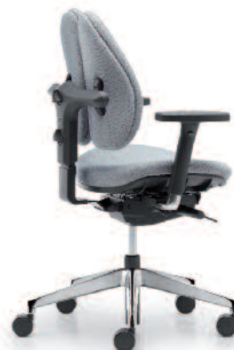
duo back® 12 | Vollpolsterrücken