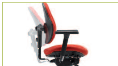
Synchronmechanik | Mit einem Öffnungswinkel 22°. Verhältnis 1:1,8