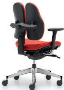
duo back® 11 | Rückenkappe in Kunststoff schwarz