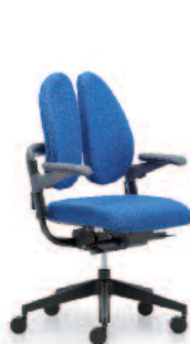
xenium-basic duo back®

Nach jedem Geschmack Wir haben das duo back® Prinzip auch in anderen Stuhlfamilien zum Einsatz gebracht.