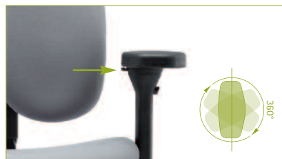
Armlehnenpad | Um 40 mm verschiebbar und 360° drehbar.