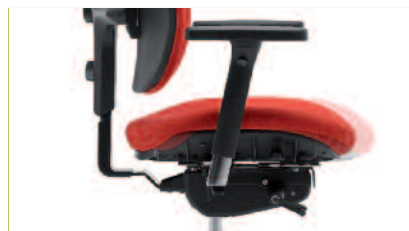
Schiebesitz | Zur Einstellung der Sitztiefe.