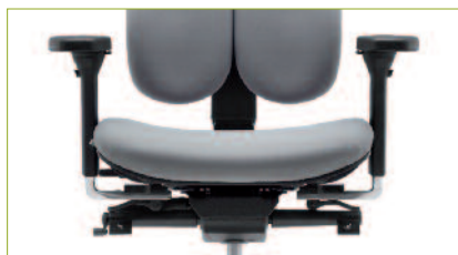
Gewichtseinstellung | Per Kurbel individuell einstellbar von 45 - 125 kg