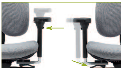
Multifunktionsarmlehne | Auf Tastendruck 100 mm höhenverstellbar und 90 mm breitenverstellbar