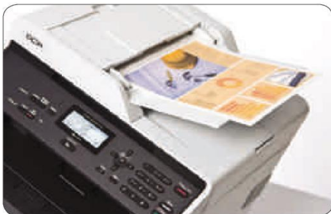
Scannen und Kopieren über automatischen Dokumenteneinzug oder Vorlagenglas

Seit 1978 vergebenes Umweltzeichen des Deutschen Instituts für Gütesicherung und Kennzeichnung e. V. (RAL) für Produkte, die im Vergleich mit anderen aus ihrer jeweiligen Produktgruppe besonders umweltschonend und gesundheitlich unbedenklich sind. Die Produktkennzeichnung ist freiwillig.