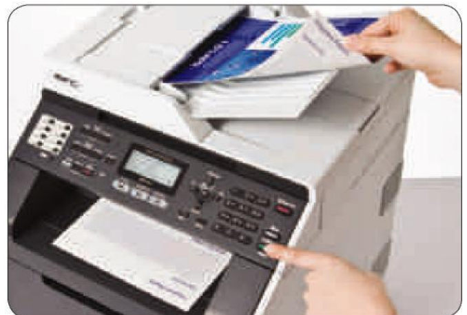
Einfache Archivierung via Automatischem Vorlageneinzug auch im Format PDF/A

Versenden Sie beidseitig beschriebene Dokumente vollautomatisch, oder empfangen Sie mehrseitige Faxe, indem Sie sie beidseitig ausdrucken lassen.