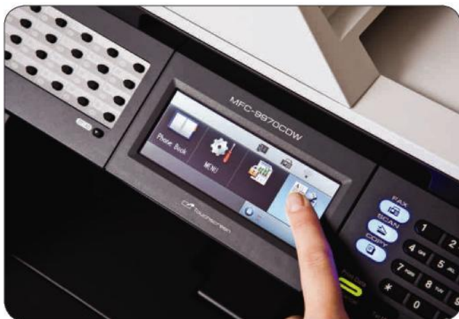
Leicht zu bedienendes LCD-Touchscreen-Display (12,6 cm)

Drucken Sie viel und benötigen Sie daher mehr Papierkapazität? Kein Problem: Das MFC-9970CDW kann eine weitere Papierkassette für 500 Blatt aufnehmen, so dass Sie insgesamt bis zu 800 Blatt einlegen können.