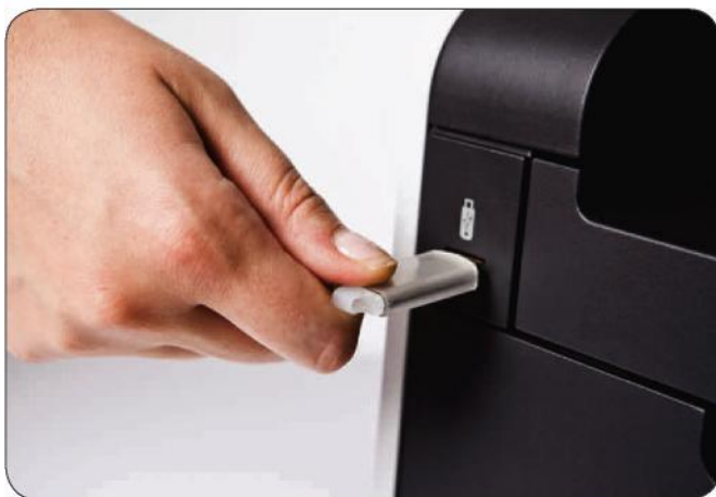
Direktes Drucken vom USB-Stick