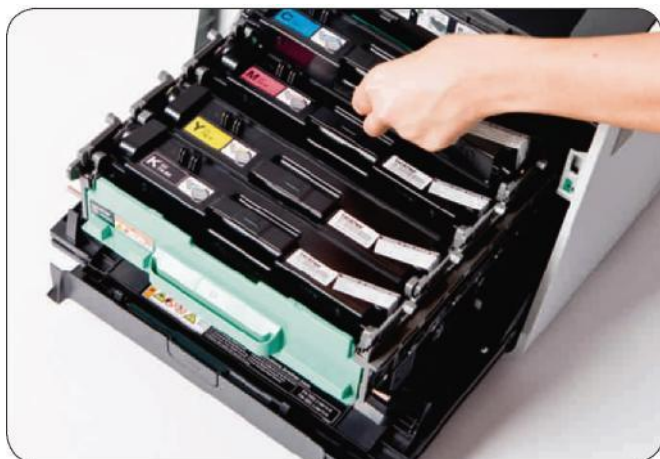
Druckkosten verringern durch optionalen Super-Jumbo-Toner

Mit nur 1,8 Watt im Tiefschlafmodus ist das MFC-9970CDW sparsam in punkto Energieverbrauch. Die optionale Toner-Großkartusche (Super-Jumbo-Toner) hilft, Verbrauchsmaterial zu sparen; damit drucken Sie ca. 6.000 Seiten (gemäß ISO 19798), bevor Sie wieder eine neue Kartusche einlegen müssen.