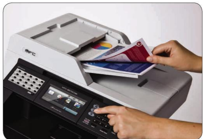
Einfache Archivierung via Automatischem Vorlageneinzug auch im Format PDF/A.

Die Produktkennzeichnung ist freiwillig.