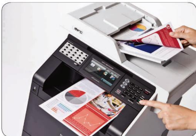
Doppelseitige Dokumente einfach beidseitig einscannen und kopieren

Das MFC-9970CDW ermöglicht Ihnen auch den direkten Zugriff auf das LDAP-Adressbuch, das heißt auf Faxnummern oder E-Mail-Adressen aus der Netzwerk-Datenbank. Über den Touchscreen suchen Sie den gewünschten Empfänger und versenden direkt vom Multifunktionsgerät aus.