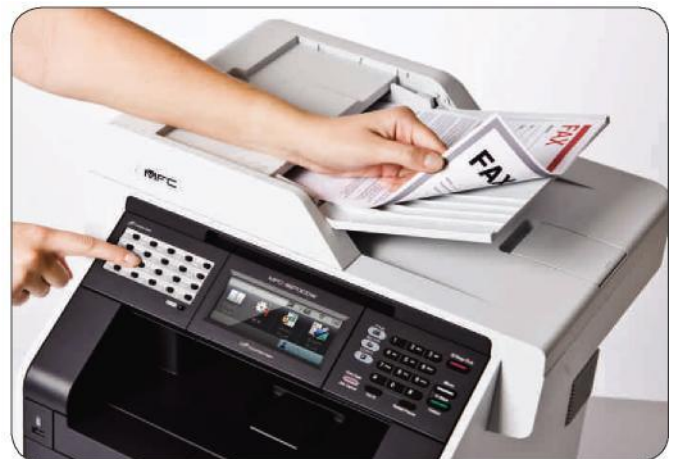
Umfangreiche Faxfunktionen optimieren Versand und Empfang