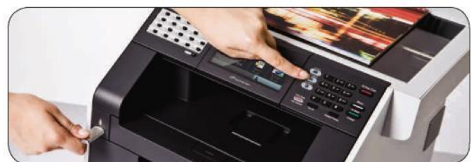
Einscannen und direkt auf USB speichern