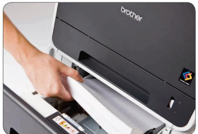
Bis zu 800 Blatt Papiervorrat: weniger Eingriffe erforderlich